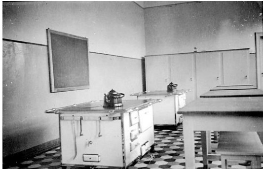
Küche in der Hauswirtschaftlichen Abteilung der Landwirtschaftsschule Brünen in den 1960er Jahren